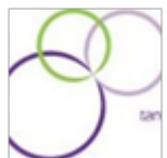
Care for Dental

Het is belangrijk om gezamenlijk actief te werken aan de bewustwording van normen en waarden bij hockey. Fatsoen, en sporti-