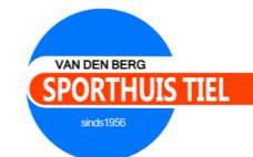
Van den Berg Sport