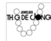
Juwelier De Jongh