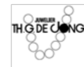
Juwelier De Jongh