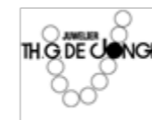
Juwelier De Jongh