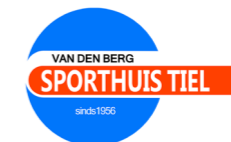
Van den Berg Sport