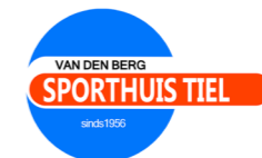
Van den Berg Sport